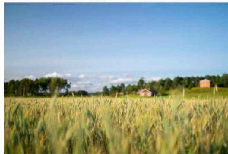
Laitila houkuttelee uusia asukkaita tarjoamalla tonttikaupan päälle vuoden kananmunat.

Laitilan kaupunki uudistaa omakotitalotonttiensa valikoimaa. Kasitien varressa sijaitsevalle Laessaaren asuinalueelle on tullut myyntiin 24 uutta reilunkokoista tonttia. Lähitulevaisuudessa myös Kotoherjun asuinalue saa laajennuksen ja kokonaan uusi asuinalue avataan Kodjalan kylään.