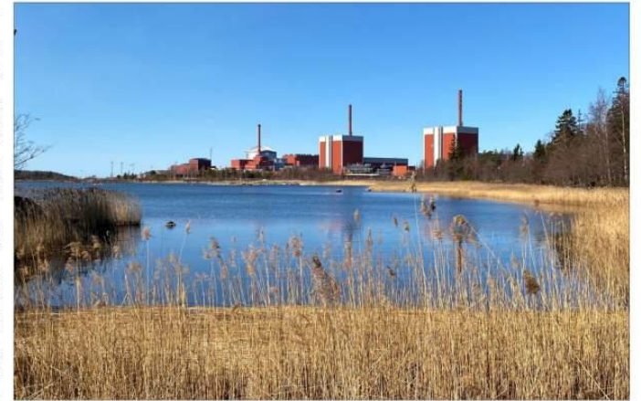
OL3 (vas.) tuotti maanantaina itäpääväällä sähköä noin 650 ja OL1 (oik.) noin 150 megawattia täystehoaan vähemmän.

Tuuli teki tehtävänsä Suomessa on tuullut viime päivinä voimakkaasti, mikä on nostanut