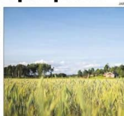
Laitila houkuttelee uusia asukkaita tarjoamalla tonttien kaupan päälle vuoden kannamunat.

– Uudet laitilalaiset pääsivät heti uuden kotikaupungin makou. Laitilassa tuotetaan edelleen suuri osa suomalaisista kannamunista. Kattelus sanoo.