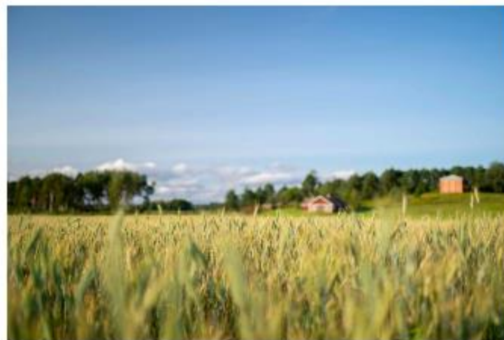
Laitilan Laessaaren tontteja myydään omaleimaisella tavalla.

Laitilan Laessaaren asuinalueelle valtatie 8:n varrelle on tullut myyntiin 24 uutta tonttia.